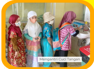
Mengantri Cuci Tangan