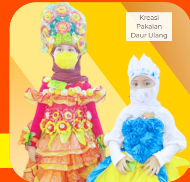
Kreasi Pakajian Daur Ulang

Lomba Senam Irama dengan alat mewakili Prov. Banten Tingkat Nasional